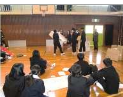
↑中山中学校での防災授業♪中学1年生全員が、真剣に積極的に取組みました!

一宮公民館では、「地域応援人づくり講座」として、年間を通してさまざまな防災への取組を行っています。