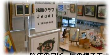
昨年のロビー展の様子です