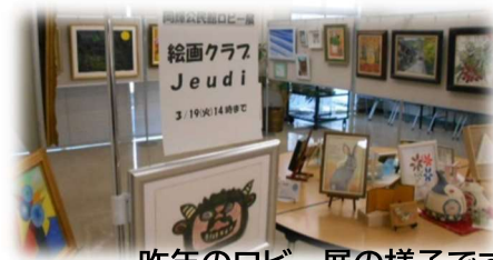
昨年のロビー展の様子です