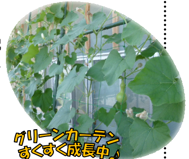
グリーンカーテン まぐすく成長中！

公民館利用の際には、引き続き、来館前の体温測定・体調のセルフチェック等、ご協力をよろしくお願いいたします。