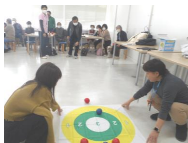
2/6 地域サロン交流会 ポッチャで交流