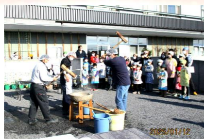
1/12 みんなでお餅つき大会