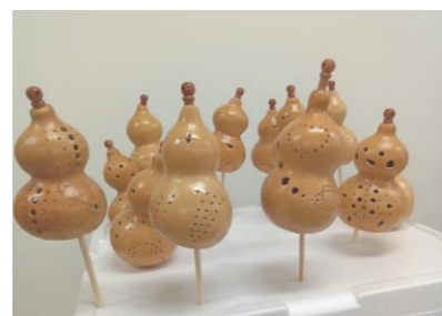
2/1 ひょうたんランプを作ろう