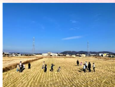
1/19 「ちちとくらぶ」の風あげ