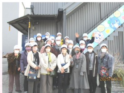
1/24 環境学習エコツアー プラスチック資源循環センターの見学