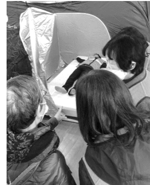
令和5年11月26日 防災訓練(宇野小学校にて)

2年間副会長として、防災訓練等を中心に業務に従事させていただきましたが、改めて「顔の見える関係」の構築がいかに重要であるかということを感じました。