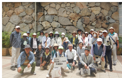
←城下交差点地下で見つけた内堀の石垣をバックに参加者と記念撮影