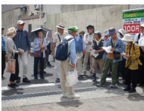
↑オランダおイネ修業地前での案内風景

講師からの詳しい説明を受けながらの見学会。新しい発見にたくさん出会えた会になりました。みなさん、お疲れさまでした！！