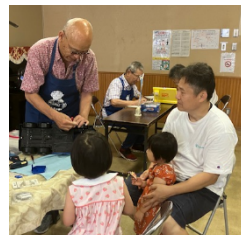
おもちゃを修理している様子

※おもちゃの病院はお子さんとドクターさんのふれあい等を通して、ものを大事にする気持ちを育む場所です。お子さんの前で修理します。お子さんと一緒にお越しください。