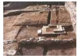
賞田廃寺の発掘の様子

古代、高島地区は一体どのような姿だったのでしょうか？この地域一帯の発掘調査に携わってこられた専門家が、その様子を浮かびあがらせてくださいます。 ご期待ください！！