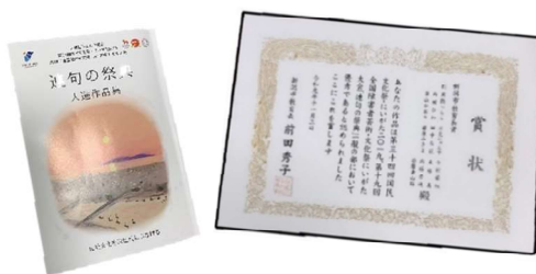
国民文化祭賞状と 入選作品集

どんな職にも昔は名人と呼ばれる職人がたくさんいましたが、今は手仕事を受け継ぐ人がおらず個人商店がなくなってきています。機械で大量生産したもので済ます風潮は仕方ないのかもしれないけれど、何か抵抗して爪を立てたい思いもあります。オーダーメイドで服を作り続けることで店の味が出るし、こだわりの服を着て歩く人がいるとまちに味わいも出る。そういうところで個性豊かなまちづくりにちょっと貢献したいと思っています。