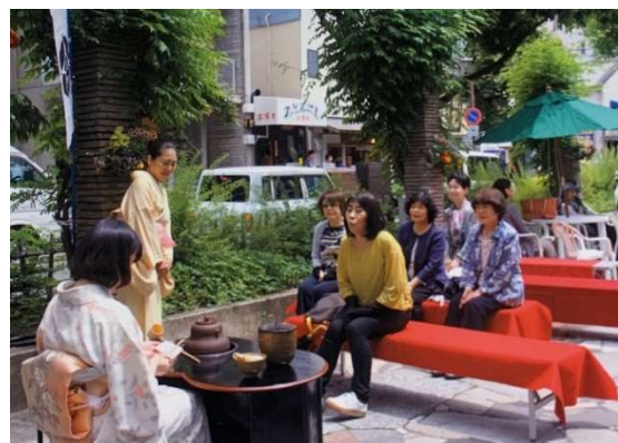
↑ 西川緑道公園での野点の様子

個人的には2年に1回程度、西川緑道公園でお茶席をさせ てもらっていて、今年開催したいと思っています。