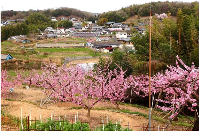
・桃畑（満開）：4月8日下見時