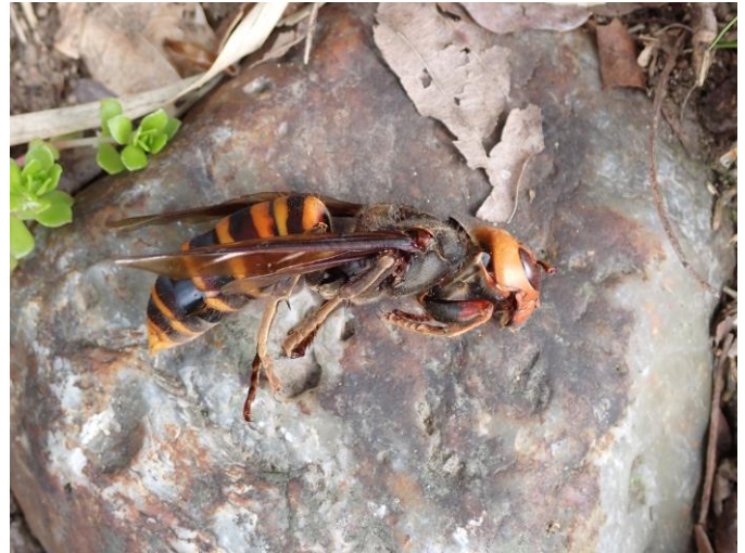
・オオスズメバチの女王（死体）