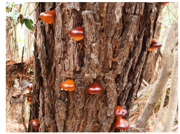
・ヒトクチタケ（枯れたアカマツに）