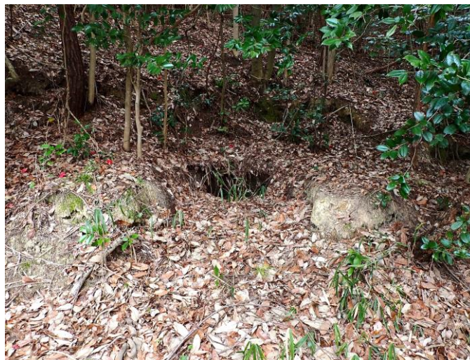
・炭焼き窯の跡（里山でも炭が焼かれていた）