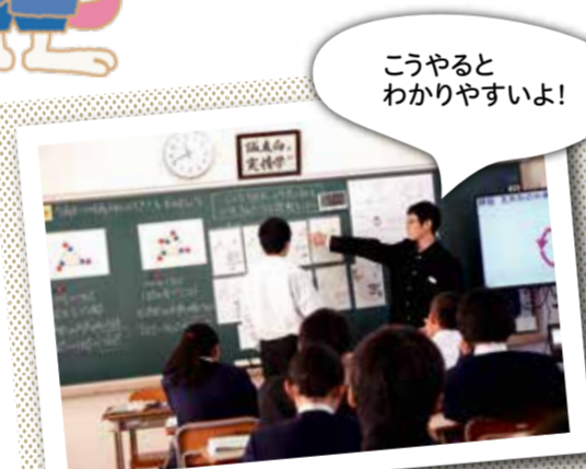
グループで意見を 出し合って考えます