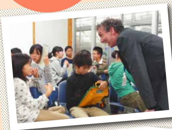
▲自由に話せる 雰囲気が出ています

さんあります。何気なく見過ごしていることに立ち止まってどんな意味なんだろうとお家の方と一緒に考えてみることで、子どもたちの外国語に慣れ親しむきっかけを作っていただければと思います。