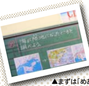
▲まずは「めあて」を 書いてから始めます

新学習指導要領で大切にしている 「主体的・対話的で深い学び」を実現する授業を目指して