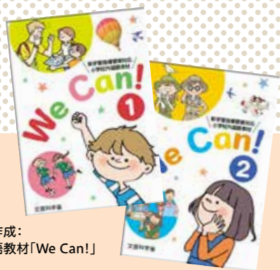
文部科学省作成 小学校外国語教材「We Can!」