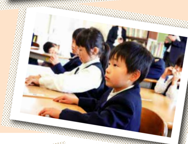
▲人の意見を 真剣に聞きます

小学校の道徳科の目標には、「道徳的諸価値についての理解を基に、自己を見つめ、物事を多面的・多角的に考え、自己の生き方についての考えを深める学習」を通して、「道徳性」を養うことが示されています。 今後出会うであろう様々な場面、状況の中で適切な行為を主体的に選択し、実践することができるよう、道徳科の授業を進めていきます。