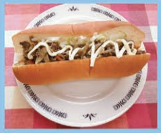
牛肉とごぼうの甘からサンド