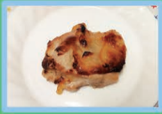
若どりのマーマレード焼き