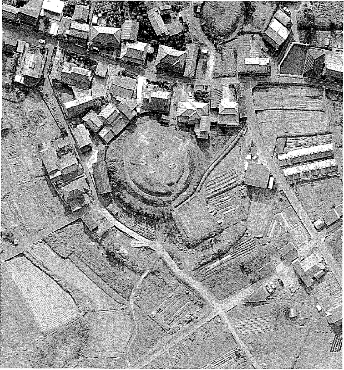
史跡千足古墳の現況