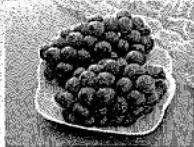
グローコールマン