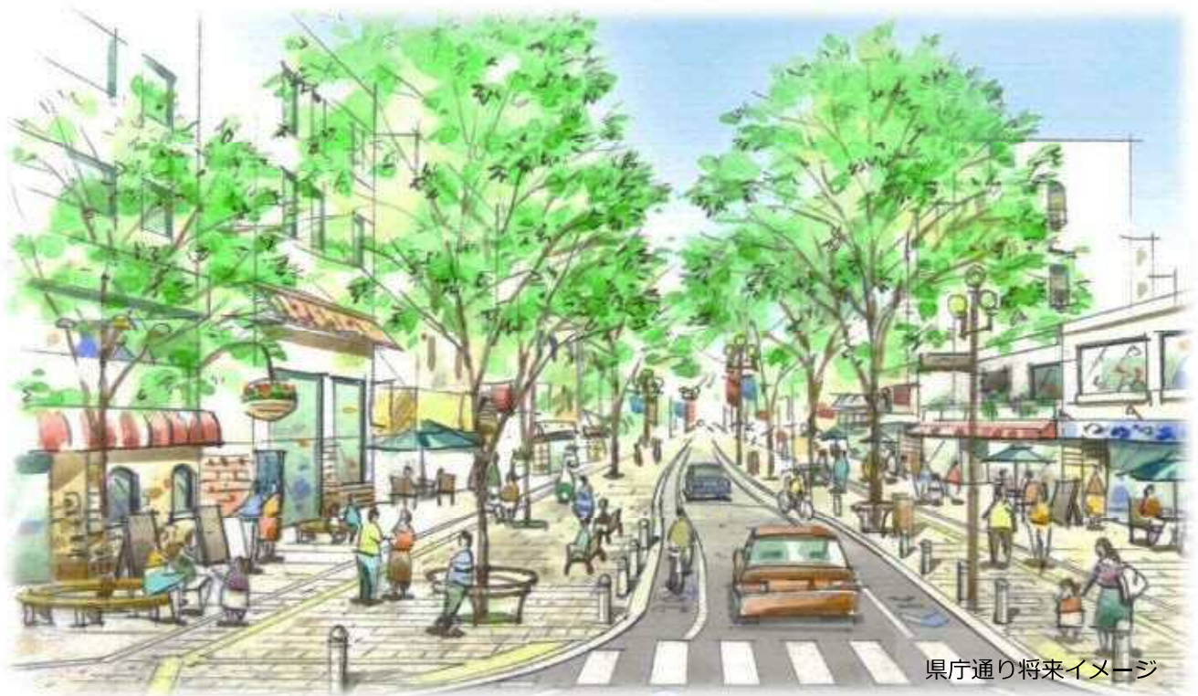
県庁通り将来イメージ