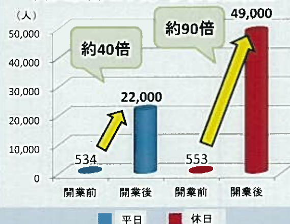
岡山駅南地下道 歩行者通行量