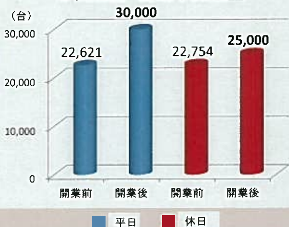
市役所筋 自動車交通量