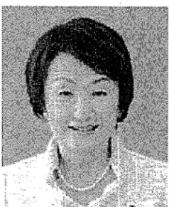
林 文子 指定都市市長会会長/横浜市長