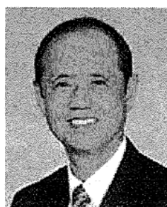
大森 雅夫 岡山市長

※出演者・講演内容は事情により変更になる場合がございます。あらかじめご了承ください。