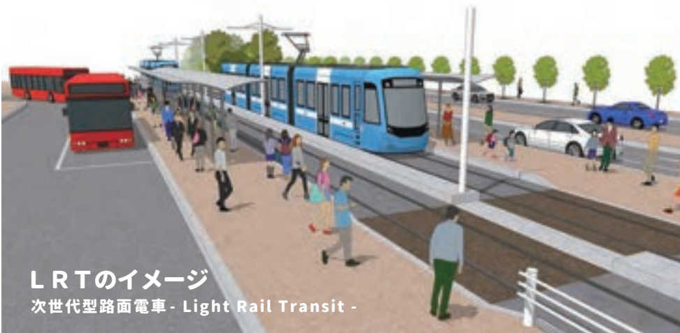
LRTのイメージ 次世代型路面電車 - Light Rail Transit -

高校生 これまで交通の話をしてきましたが、交通のあり方ってどんな人が検討しているのでしょうか。 担当者 外部の有識者の方々と交えて検討しています。 高校生 外部の有識者って具体的にはどんな人たちですか? 担当者 交通関係が専門の大学の先生や、鉄道やバスなどの交通事業者の方などを交えて話し合って検討しています。 高校生 一般の方の意見は聞かないのでしょうか?あるいは中学生や高校生といった子どもの意見は聞かないのでしょうか? 担当者 町内会長といった一般の市民の方にも入ってもらっていますが、過去には大学生のゲストから意見を伺ったこともありますし、バスの乗り方教室などのイベントを通じて小学生や高齢者など、様々な方の意見を取り入れるようにしています。 高校生 へえ〜そうなんですか〜! 一般の方の意見も取り入れるよう工夫されているんですね!