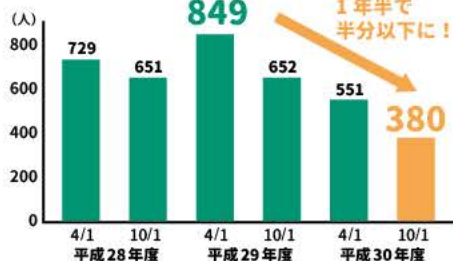
岡山市の待機児童数推移(過去3年間)

高校生 1年半で半分以上に！？すごい！！今後、もっと減らすための取り組みはあるんですか？