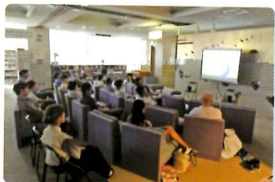
7/16 「映画『ザ・トゥルー・コスト』をみて今の世界を考えてみよう！」