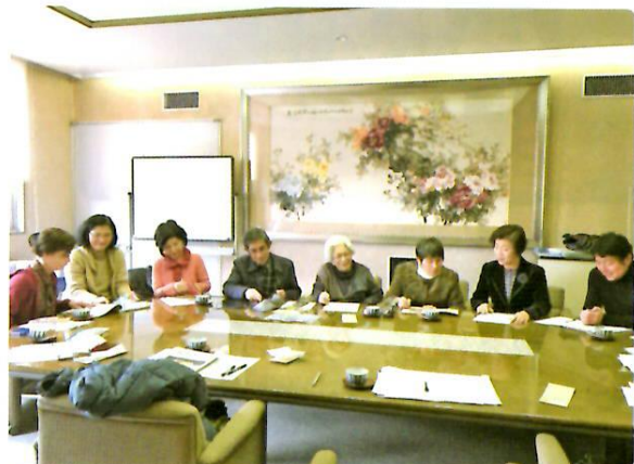
あくら編集会議の様子