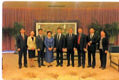
表敬後の全体写真