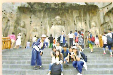
世界遺産の龍門石窟を見学