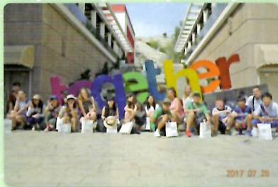
欧州文化都市 2019 モニュメントにて