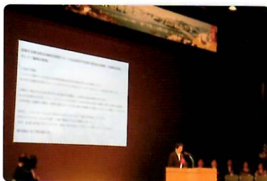
北前船寄港地フォーラム開幕式で挨拶する李主任

李少敏主任を団長とする洛陽市人民代表大会常務委員会訪日団一行6名が岡山市で開催された「第20回北前船寄港地フォーラム in おかやま」に参加するため来訪し、岡山市長・岡山市議会議長を表敬訪問や市内視察を行いました。フォーラム等への参加を通し、岡山市の取組や魅力に触れていただき、更なる交流を深め、両市の友情の輪を一層広めました。