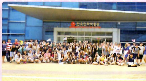
韓国漫画博物館前