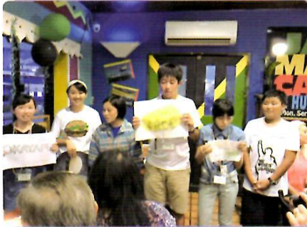
英語で岡山市の紹介