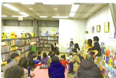
1/13 中国語 (幸町図書館)