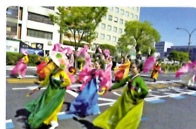
うらじゃパレードに参加