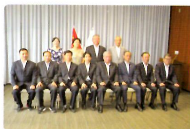
岡山市長、岡山市議会議長表敬訪問