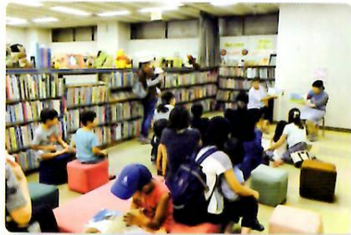
7/30 英語 (幸町図書館)