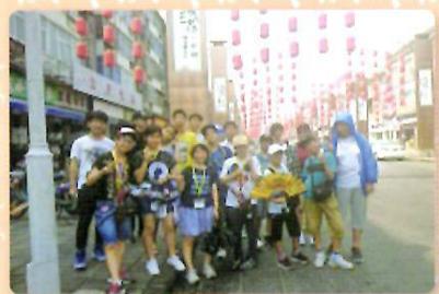
洛陽市の旧市街散策