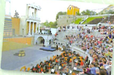
オペラ鑑賞（古代劇場にて）