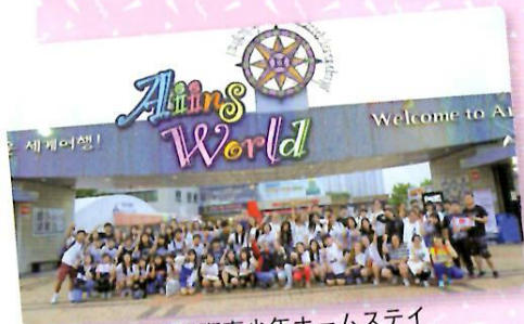
富川国際青少年ホームステイ 5カ国全員集合