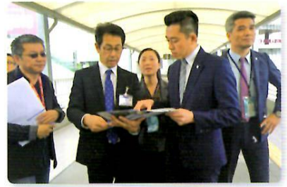
岡山駅西口の視察