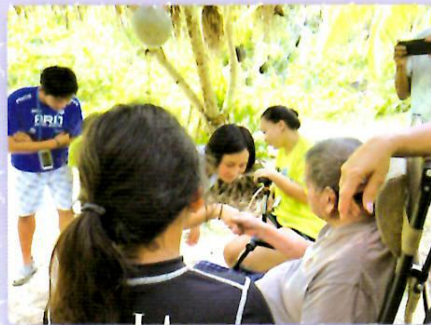
チャモロ伝統の挨拶