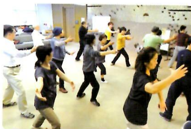
10/28 「健やかに楽しむ！ 太極拳体験講座」