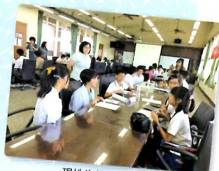
現地生徒との交流