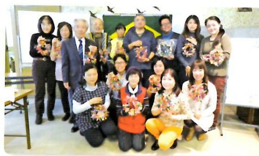
12/3 「ブラジルのクリスマスは面白い！」

昨年度に続きフェアトレードをテーマにした映画会や多言語によるおもてなし講座を開くなど、外国人市民と日本人市民が幅広い観点から国際交流を促進できるような異文化体験交流会を開催しました。（4回の実施）