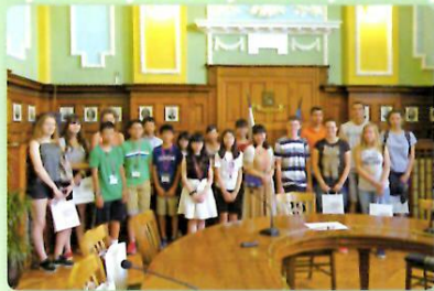
プロヴディフ市副市長 表敬訪問