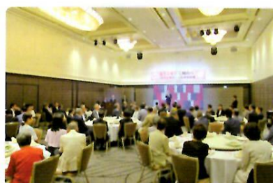
岡山市主催の歓迎夕食会にて