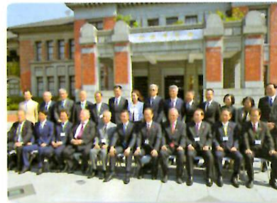
新竹市政府庁舎前にて