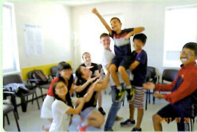
現地の子どもたちとの交流