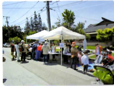
日系まつりでのブース出展