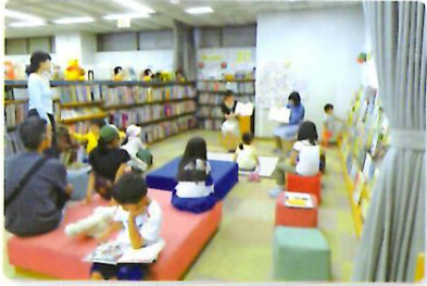
5/28 韓国語 (幸町図書館)

子どもたちに外国や外国語に興味を持ってもらおうと岡山市中央図書館と幸町図書館との共催で6回開催しました。図書館の職員と外国人講師がペアになり、英語、中国語、韓国語で行いました。