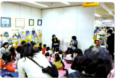
11/25 英語 (中央図書館)