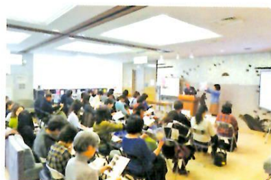
2/24 「多言語でおもてなし —後楽園入門講座—」