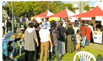
おかやま国際音楽祭2017下石井3DAYS (下石井公園)