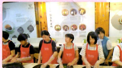
キムチ作りに挑戦