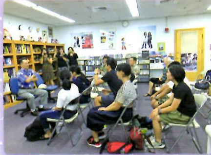
在ハガツニャ日本国総領事館を表敬訪問