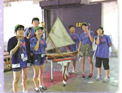
グアムの伝統カヌー「サクマン」