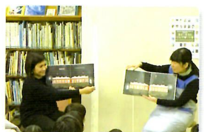
2/25 英語 (幸町図書館)