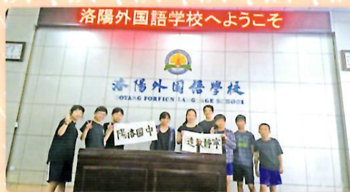
洛陽外国語学校の生徒と交流