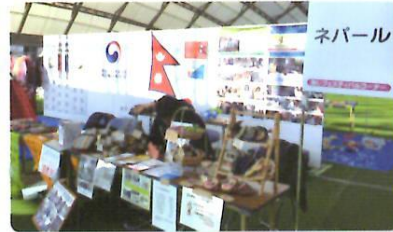
第22回人権フェスティバル岡山 (岡山ドーム)