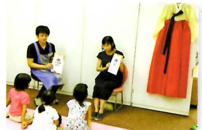
9/9 韓国語 (中央図書館)