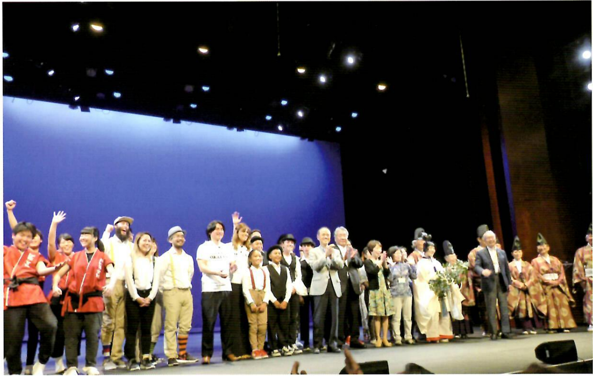
岡山市・サンノゼ市姉妹都市締結60周年記念 岡山市民友好親善訪米団 文化交流プログラムでの様子