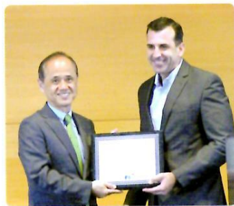
サンノゼ市長より60周年表彰状の贈呈