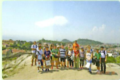
プロヴディフの丘にて