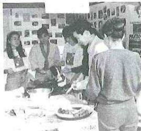
ウチの名物料理だ！おいしいヨ