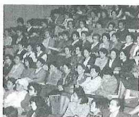
会場いっぱいの参加者