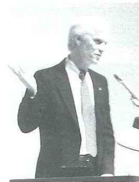
▶講演中のシュワイカート氏

これからは、資源を効率的に活用するための技術開発を進め、地球への負担を軽減するとともに、マイナス要素を単に懸念するだけでなく、世界規模での行動に転化し、物質的かつ意識的に宇宙に向かって開かれた生活が大切になってくるだろう。