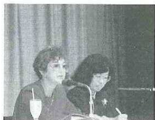
体験談や持論を披露

それでは、ここで『インターナショナル・ウィーク'90』のイベントの数々を振り返ってみましょう。