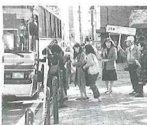
元気で行ってきま〜す!