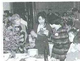
こちらは文学談義？