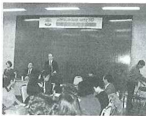
鹿子木市助役(実行副委員長)が挨拶

外国人留学生等を対象に市民宅へ1泊2日のホームステイを実施。市役所で市民と外国人が顔合わせ後、27家庭のホストファミリー宅へ向かい、日本家庭の生活習慣、食文化を体験。(11/10・11, 市内一円)