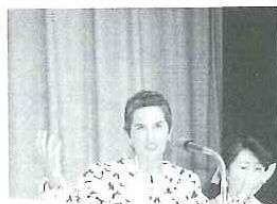
活気あふれるパネラー席