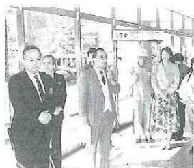
宮崎ライオンズ会長が挨拶