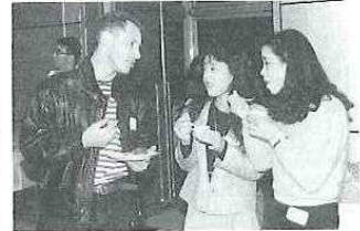
ふれあいの輪が広がって