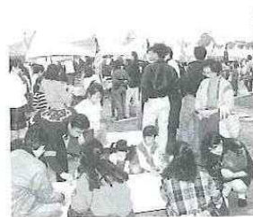
独楽(こま)で国際交流