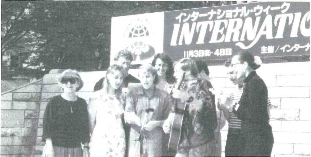
インターナショナル・ウィーク「世界あれこれ・ふれあいランド」交流の様子

発行 岡山市国際交流協議会 岡山市役所秘書課内 〒700 岡山市大供1-1-1 TEL. 0862-25-4211