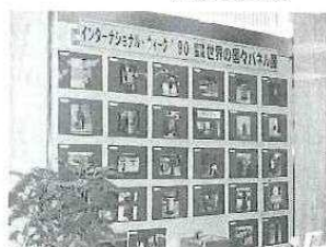
珍しい切手やポスト(写真)が好評