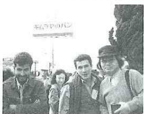
岡山木村屋パン工場を視察