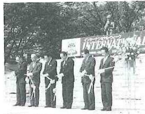
待ちに待ったオープニング