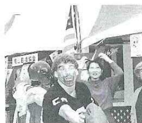
楽しさあふれる会場