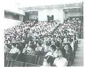
▼熱心に聞き入る参加者