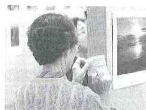
この写真が気に入ったわ (市民投票)