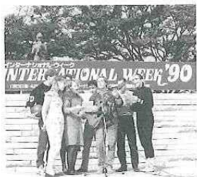
カントリーソングなら「おまかせ」