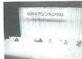
壇上から語りかける