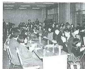
外国人と市民が“お見合い”