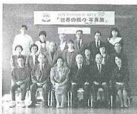
堂々の優秀作品表彰式 (市役所)