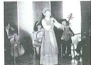
中国の伝統音楽にウットリ