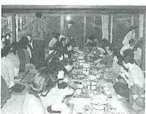
湯豆腐ランチはいかが (宝福寺)