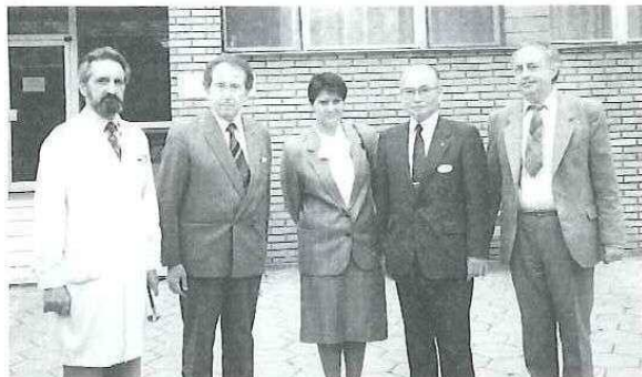
医学アカデミー学長(左から2番目)らと (右から2番目が筆者)