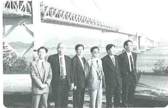
▲ 中国の要人も訪れた瀬戸大橋にて。