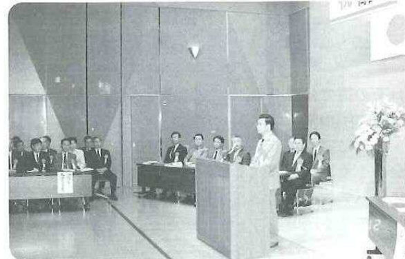
▲ 5月12日に開館日を迎えた西川アイプラザ。その開館式典において、周国華洛陽市副市長が祝辞を述べた。4階友好交流サロンでは両市の『交流のあゆみ展』を見学。