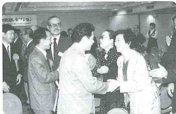
▲ 岡山市民からの温かい歓迎に笑顔で応える一行。