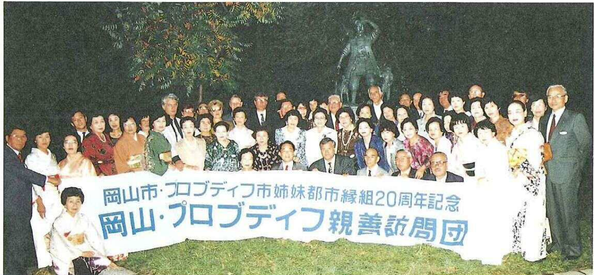
桃太郎像の前で（プロブディフ）