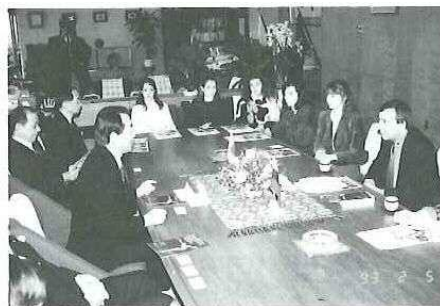
◀ 市長表敬訪問に可愛い妖精達は少し緊張気味？