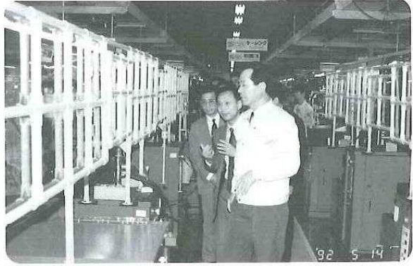
▲ 松下ビデオ工場では、部品から製品までを一貫生産しており、自動化で能率のよい生産ラインを視察。時折、足を止めては機械の敏捷な動きを熱心に見ていた。