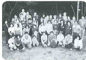
『バスツアー& ホームステイ』 に参加（'94. 11）

また、お二人は様々な国際交流活動に積極的に参加し、市民の方々との身近な交流を深めました。帰国後は、母国の発展に貢献をされています。