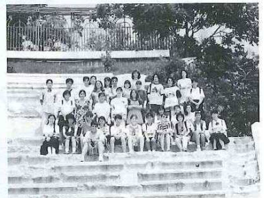
プロブディフグループ