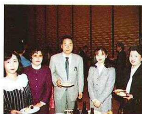
国際交流の話をしながら 親睦を深める会員