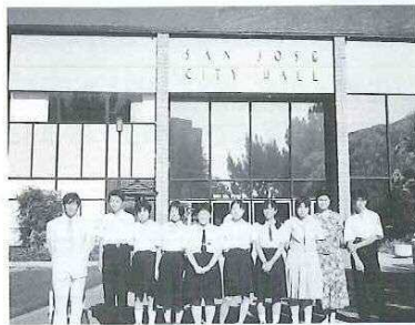
サンノゼグループ