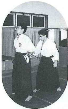
合気道の実技研修