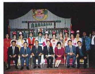
洛陽韶樂鑑賞後の記念撮影