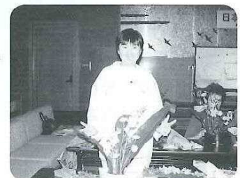
日本文化紹介講座で 『生け花』を体験 （'95. 4）