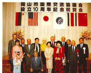
ホーバー御夫妻、梶谷前会長を囲んで