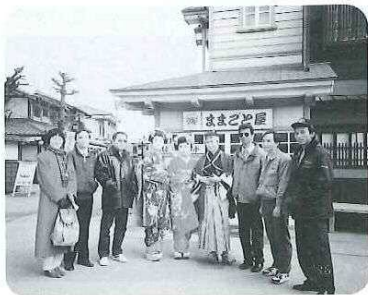
一緒に視察をした第2回アジア奨学生と