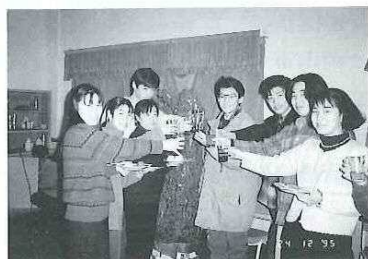
洛陽工学院のクリスマスパーティにて