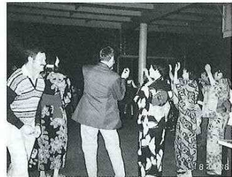
SAYONARA PARTY では皆で「盆踊り」を踊りました。