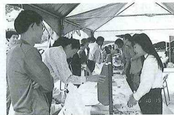
国際電話フリーコール(10/19・20)