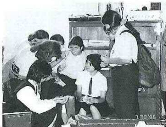
これが日本のお礼です。