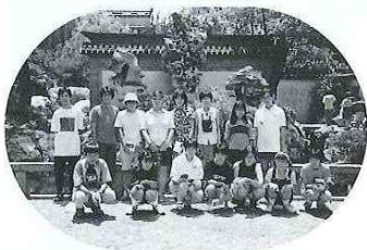
洛陽市派遣グループ