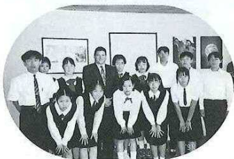
サンホセ市派遣グループ