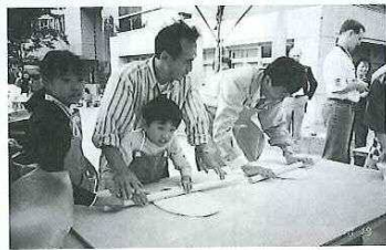
手打ちうどん大会(10/19)