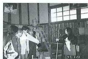
↑「商家資料館」にて、醤油作りの工程を説明。 ↓