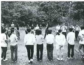
野外活動を通じて現地の子供たちと交流。