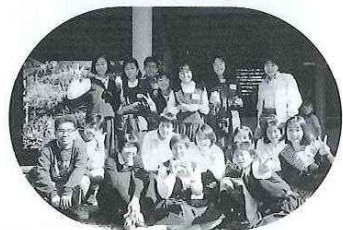
ブリスベン市派遣グループ