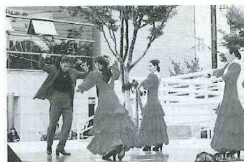
ステージパフォーマンス(10/19・20)