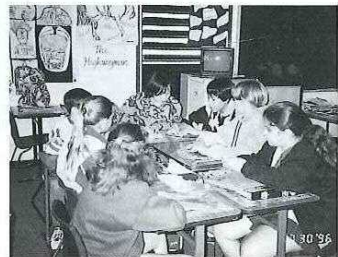
折り紙を通じて日本文化を紹介。