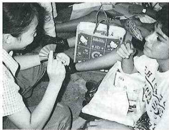
日本からのお土産を渡しました。