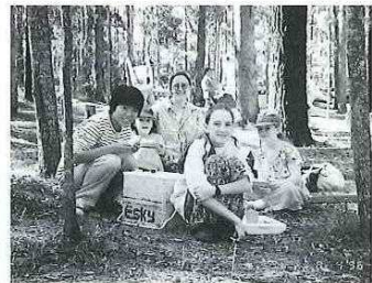
ホストファミリーとのキャンプ。