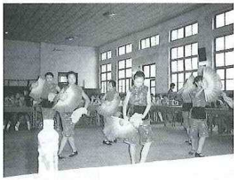
洛陽外国語学校を訪問。