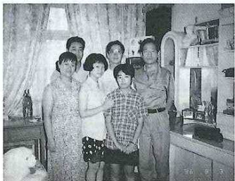
ホストファミリー宅にて。