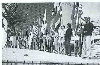
オープニングイベント(10/19)