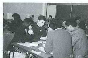
「総合福祉センター」にて、研修のまとめとして各自のウィークポイントや質問・疑問点について話し合いました。