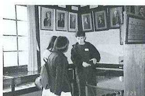
↑「郷土資料館」での研修風景。 ↓