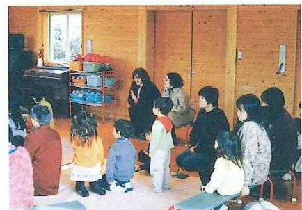
馬屋下児童館を訪問