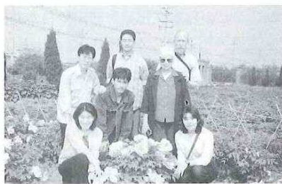
「牡丹園にて」(前列左)

うものは、政治上の区切りにすぎないのではないのでしょうか。どうしたら人と気持ちよく付き合えるか、相手のことをより良く理解できるか、こうした問題に関してはどこの国でもあまり違いはないように思われます。