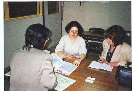
岡山市社会援護課にて老人保健制度や福祉医療についての説明を受ける

最後になりますが、前述のことと同様に日本の文化と伝統を身近に体験できたということも本当に素晴らしい経験でした。そのうえ、すてきな日本人の方々と交流でき多くのよき友人を得たことを大変嬉しく思います。