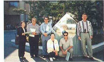
岡山ふれあいセンター視察