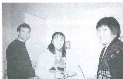
「宿舎にて水餃子作りを習う」(中央)

この先、故郷岡山と大好きな洛陽がより一層友好関係を深めていけるよう、今回の留学経験を生かし、微力ながら協力していきたいと思わずにはられません。そしていつの日か洛陽の方々に恩返しできる日が来る事を願っています。