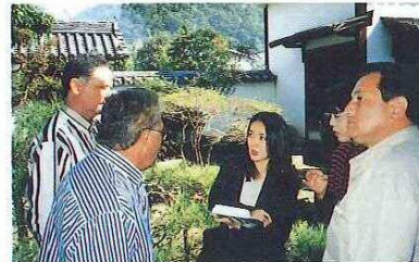
足守保存地区視察