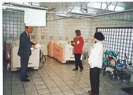
養護老人ホーム・岡山市会陽の里を訪問 施設の概要について説明を受け園内を見学