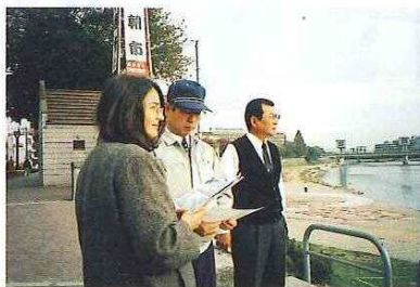
台風10号の被害地区を視察 ▼(写真一番左)