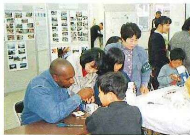
リユースプラザ岡山で、牛乳パックを利用したリサイクルおもちゃづくりを体験