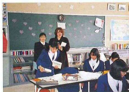
清心中学校・清心女子高等学校を訪問し 授業を見学 また学校の概要や特色の説明を受ける