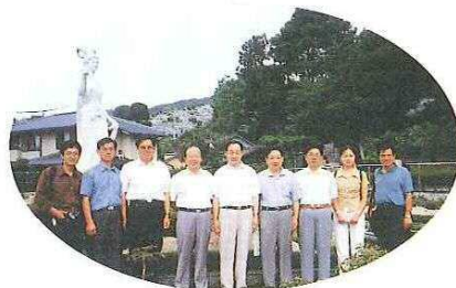
◀半田山植物園を視察 「牡丹仙女」の前で