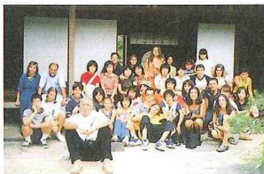
▲ホストファミリーと一緒に、足守の侍屋敷、近水園、足守プラザ等を訪問した。