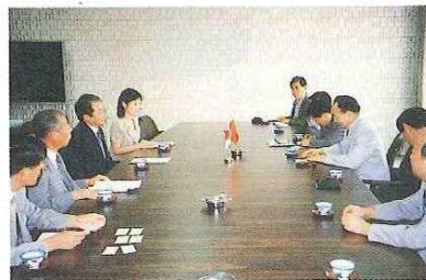
岡山商工会議所岡崎会頭 を表敬訪問