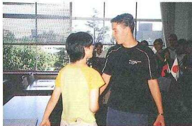
▲岡山到着の日、岡山市役所にてホストファミリーとの対面式が行われた。訪問団の子供達はホストファミリー宅で6日間過ごし、日本の一般的な家庭生活を体験できた。

同訪問団は岡山滞在中、同年代の子供のいる家庭にホームステイをしながら、市内及び県内の視察やプロブディフ市出身のスポーツ国際交流員がサッカー指導を行っている中学校の訪問等を行いました。