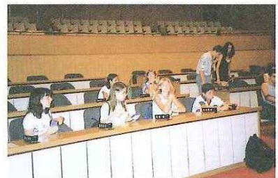
▲岡山市議会議場を見学