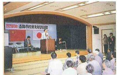
▲養護老人ホーム・岡山市会陽の里を訪問。施設内の視察や入所者との交流を行った。