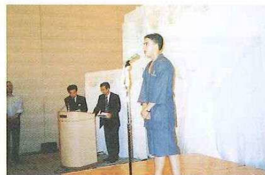
▲送別会では、訪問団の代表から岡山滞在中にお世話になったホストファミリー等へのお礼の言葉が述べられた。