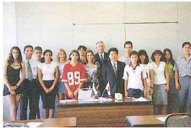
▲岡山市長を表敬訪問