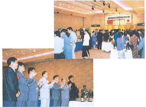
▲岡山東急ホテルに於いて開催された「歓迎レセプション」には、協議会会員、来岡中の洛陽市技術研修生、洛陽市へ派遣した技術研修生、岡山市関係者等約100名が出席し一行の来岡を歓迎した。