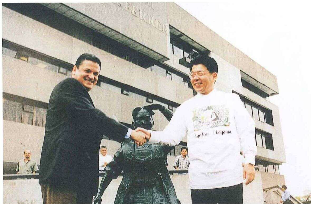
11月10日～18日 岡山市・サンホセ市姉妹都市締結30周年記念『岡山市民親善訪問団』派遣 岡山市が寄贈した桃太郎ブロンズ像の前で固い握手を交わす萩原誠司岡山市長とジョニー・アラヤ・モンヘ サンホセ市長