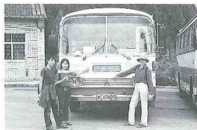
「こんな所にも小さな交流が…」（左から2人目） ＜日本から寄贈されたバスの前で＞

以前、中国人と日本人の国民性の違いについて書かれた本を読んだことがあります。そこには、2ヶ国の性格は水と油のようなもので、全くあわないと書かれていました。しかし、この一年間中国の人との交流を通じて、国民性の違いや習慣の違いは、友好関係を作っていく上では、何の障害にもならないと思いました。言葉の違いはあるけれども、真の心と心のつながりがあれば、国境を越えて人々は仲良くなれることを実感しました。