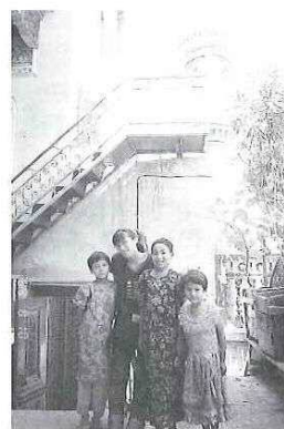
「カシュガルの小さなモスクにて子供たちと」（左から2人目）

この前中国の友人から一通の手紙が届きました。彼女が私にくれた言葉—私達は国家や文化が違って、同じ人間として共に“真・美・義”を追いかけていこう—これは、今私にとって、最高の宝物です。