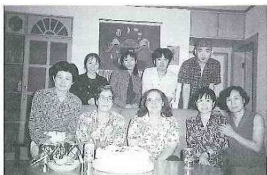
「先生のお宅で国慶節を祝う」（前列左）

故郷に戻ったこれから先は、岡山市の方々や友好都市洛陽についてもっと知ることができるように、私が現地で学んだことや体験を、できるだけ多くの機会を通して発表していこうと考えています。