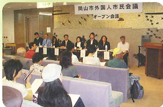
オープン会議の様子

平成20年1月から平成22年1月の任期2年にわたり議論を重ねてきた外国人市民会議(第2期)は、オープン会議の開催などを経て、平成22年1月29日に提言書を岡山市長に提出しました。