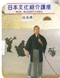
後楽園遊扇会会長

外国人市民の方々からの、日本の様々な文化を知りたいという声にお応えして、「日本文化紹介講座」を開きました。1月30日に行われた「投扇興」(開いた扇を的に向かって投げる遊び)には、約20名の方に参加いただき、後楽園遊扇会の会長及び会員の指導のもと、楽しい時間を過ごしました。