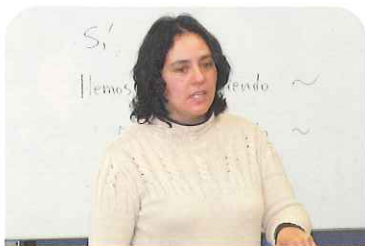
スペイン語(入門・初級)