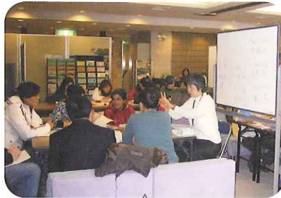
毎週木曜日（西川教室）、友好交流サロン全体が教室になります。レベルに応じていくつかのグループにわけて、1日延べ100名以上の人が通っています。