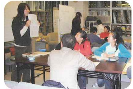
夜間のクラスは留学生の受講生が目立ちます。