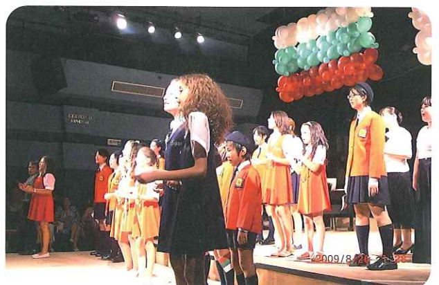
スラベナとの合唱