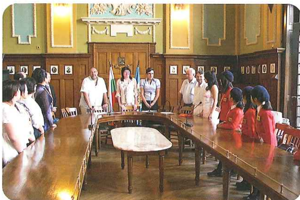
副市長表敬 (中央が副市長)