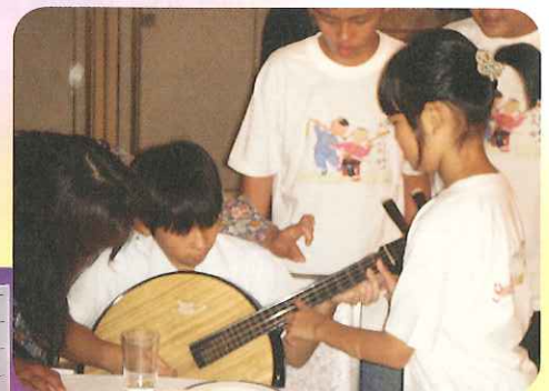
岡山市立吉備小学校の生徒たちと 音楽を通じて交流