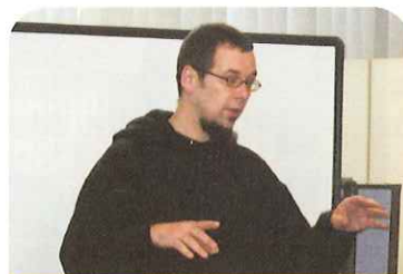
シニア英会話(火曜)