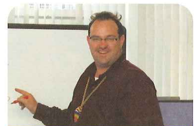
シニア英会話(水曜・金曜)