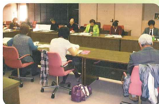
打ち合わせの様子

日本人市民と市内に在住する外国人市民が円滑なコミュニケーションを図り、日本社会に溶け込めるよう、言語面での支援をしていただく、岡山市多文化共生推進コーディネーターを募集・登録し、1回目の打ち合わせ会議を開催しました。