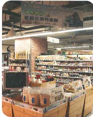
販売及び試食コーナー