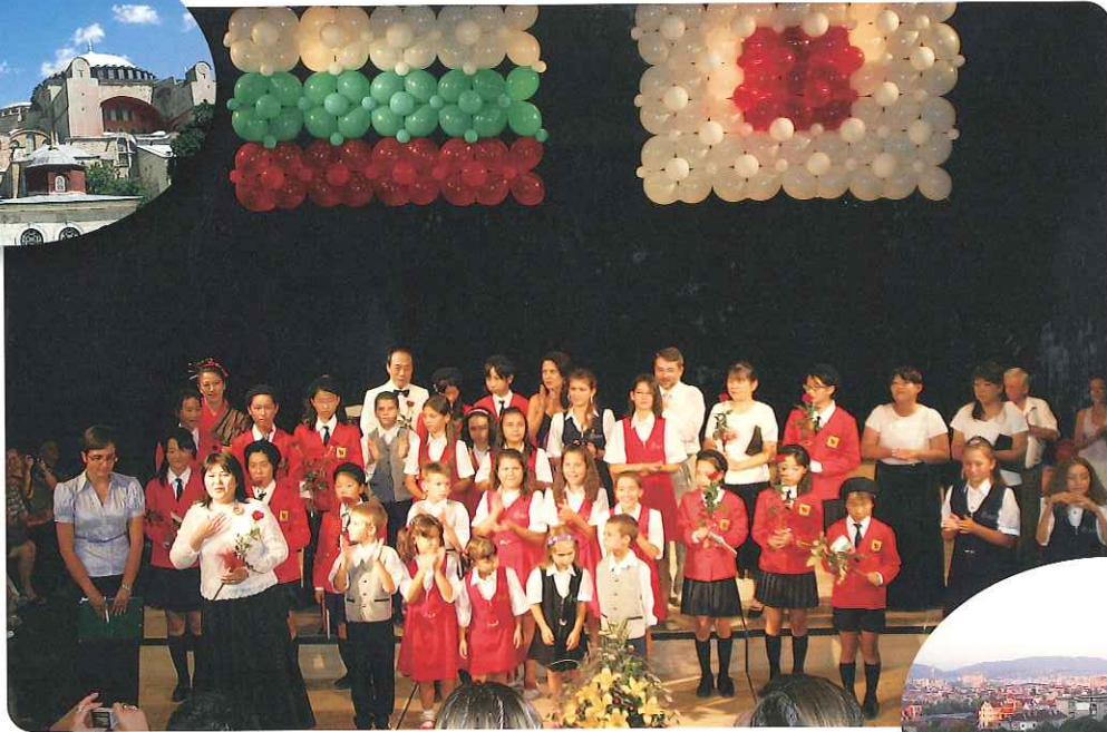
「岡山少年少女合唱団ブルガリア・トルコ親善公演」より