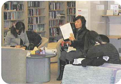
授業後、先生たちがいつも意見交換を行います。

無料の日本語教室を西川教室（木曜日の午前・午後・夜間）・京山公民館教室（毎週土曜日の午前）・岡輝公民館教室（毎週月曜日の午前）の3教室で開催しています。いつでもだれでも気楽に参加できます。ボランティアの先生方は月に一度の研修会、年に1回の講習会を通して、教えるノウハウを切磋しながら、情熱的かつ真剣に授業に取り組んでいます。