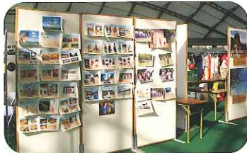
物産品販売と文化紹介

会場内に、あいフェスティバルコーナーを設けました。外国人市民による、文化紹介や物産品販売が行われたほか、ワールド屋台では、各国自慢の料理が販売され、多くの市民がさまざまな国の文化にふれることができました。ステージでは、民族パフォーマンスが披露されました。