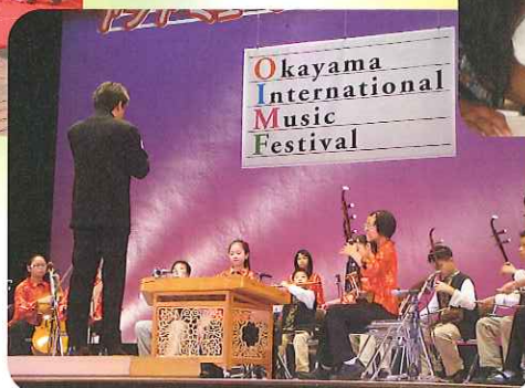
市民会館のステージにて