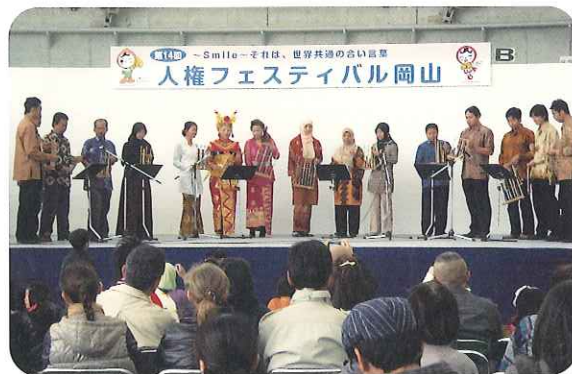
民族パフォーマンスの様子