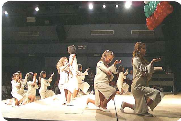
スラベナの出し物

姉妹都市のプロブディフ市からの招へい等により、岡山少年少女合唱団ブルガリア・トルコ親善公演訪問団総勢25名はプロブディフ市を訪問し、地元合唱団「スラベナ」とジョイント・コンサートを開催し、「さくらさくら」「浜辺の歌」など日本のわらべうたを披露したほか、ブルガリアの歌「STRYAHA」をブルガリア語で現地の子どもたちと合唱しました。