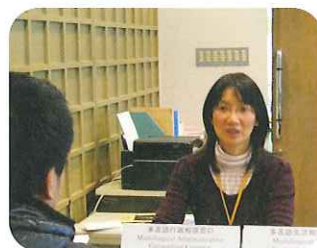
友好交流サロンの相談窓口にて

現在の経済情勢等により外国人市民からの相談等が増加していることから、10月より、相談員2名を配置し、中・東・南区役所で多言語行政相談、友好交流サロンとさんかく岡山で多言語生活相談を開始しました。対応言語は、英語と中国語となっています。