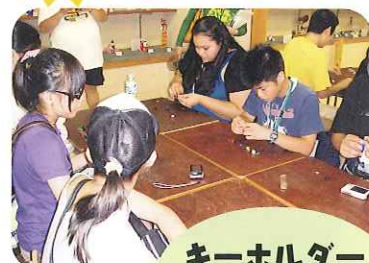
キーホルダー づくりに挑戦