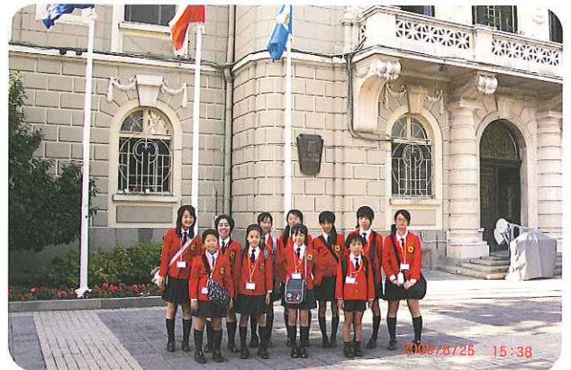
市庁舎前での集合写真