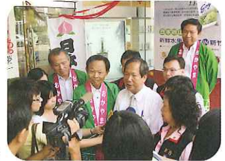
現地のマスコミを通じて、積極的にPR