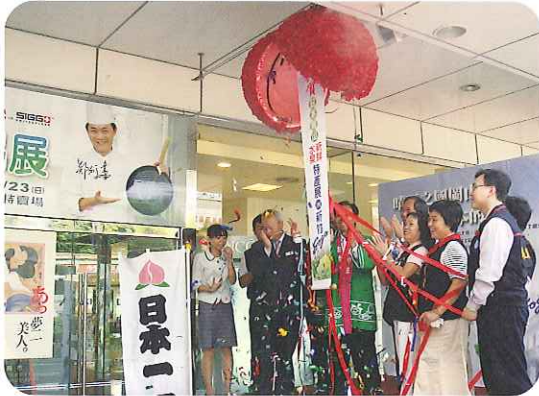
新竹市内百貨店でのオープニング

今回のフェアは、本年4月に両市の特産品の販路拡大のための相互支援について岡山市・新竹市友好都市議員連盟が新竹市との間で締結した協議書に基づき、新竹市内の百貨店において昨年引き続き実施したものです。開催期間中、ぶどう、ジャム、米などが一般消費者向けに販売されたほか、試食宣伝や観光PR活動なども行われました。