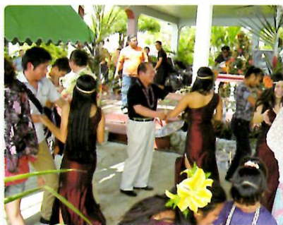
タモン・タムニン地区アイランドフィエスタにて