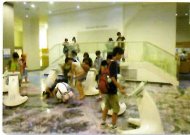
デジタルミュージアム見学