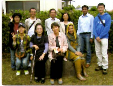
研修視察先での集合写真

http://www.city.okayama.jp/shimin/kokusai/kokusai_s00169.html