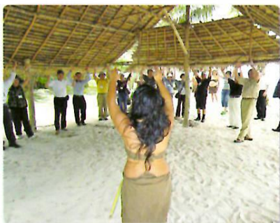
チャモロダンス体験