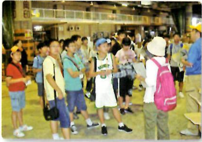
中央卸売市場にて競り見学