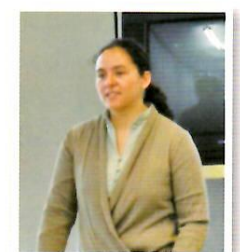
ゲティル・マル・ボリス・加藤先生 スペイン語会話（初級）