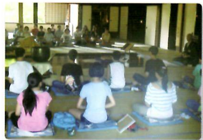
曹源寺にて座禅体験