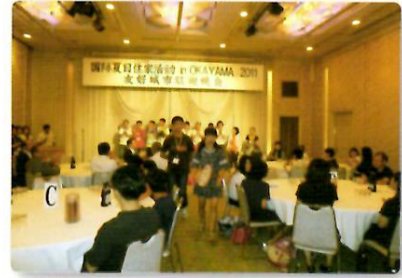
ウェルカムパーティー

岡山市の国際友好交流都市を中心とした都市の子どもたちが、岡山市でのホームステイや交流プログラムを通して、相互理解を深めることを目的に「国際サマーホームステイ in OKAYAMA 2011」を実施しました。今回は東日本大震災の影響から、中国・洛陽市 10 名のみでの参加となりましたが、岡山市中央卸売市場での競り見学やぶどうの食べ比べ、曹源寺での坐禅体験、デジタルミュージアムの見学などを行い、交流を深めました。