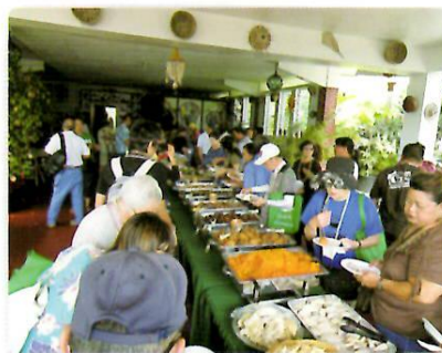
アイランドフィエスタにて チャモロ料理を堪能