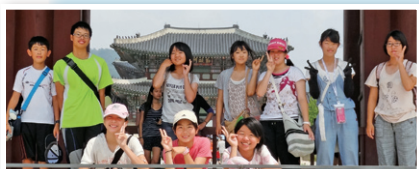
景福宮正門前にて