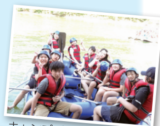
キャンプ (水上ミッション)

私は今後、苦しいこと・悲しいことなどさまざまな壁にぶつかると思います。でもそんな時は、ホームステイで学んだことを思い出し、勇気・希望・自信にかえ、頑張っ壁を乗り越えたいです。そして、また似たような経験をする時があれば、今の自分よりも、もっともっと成長した自分になりたいです。ありがとうございました。