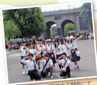
世界遺産龍門石窟の正門前にて