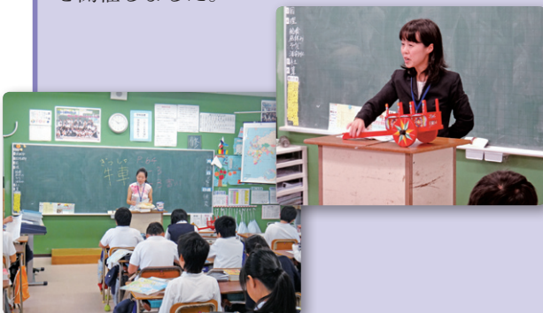
国際友好交流都市の民芸品、民族衣裳などを紹介

市内の小学生を対象に、岡山市の国際友好交流都市などについて紹介する「国際理解出前講座」を開催しました。