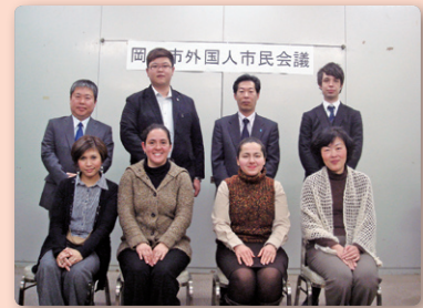
第 3 期委員

平成 25 年 3 月、外国人市民の視線から岡山市のまちづくりについて提言をまとめました。