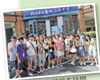
現地の中学校を訪問