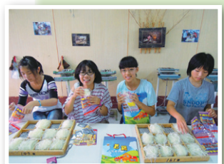
新竹名物の蜂蜜餅づくりに挑戦

日本を初めて離れてみて、私は狭い世界で生活していたことに気づき、視野を広げることができたと思います。これからはいろいろな国を訪れ、たくさんの文化や伝統、歴史を学びたいです。そして、私が幼い頃には気づけなかった、日本の素晴らしい文化も伝えていきたいです。