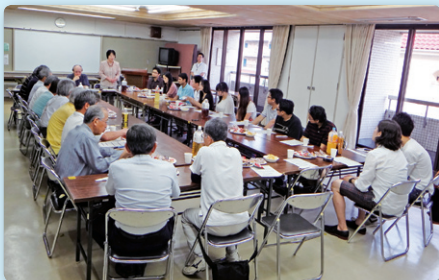
各町内会長と外国人留学生との交流会 (平成 24 年 7 月 2 日)

地域のお祭りなどに多言語版のチラシを作成して外国人市民を招待したり、町内会長と外国人留学生の交流会を開催しました。