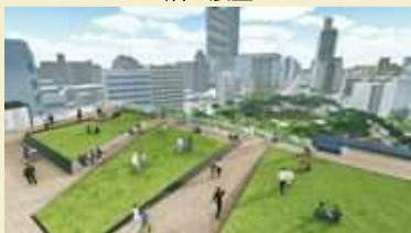
▲6階の議場屋上テラス (完成イメージ)