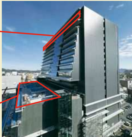
▲工事中新庁舎 (令和8年2月末現在)