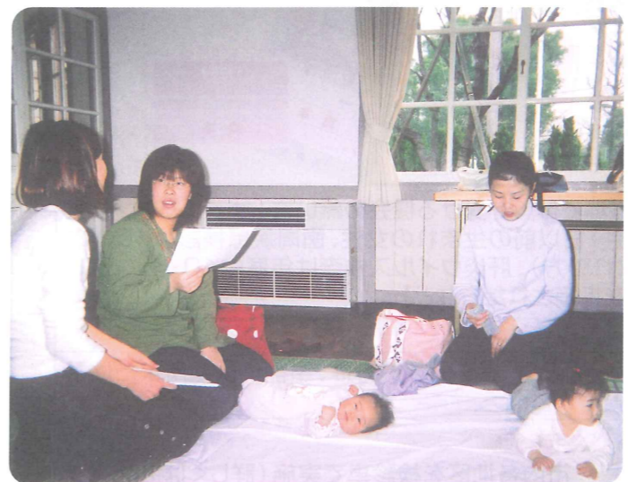
お母さん同士で情報交換

岡輝地区では、八角園舎で育児相談が月一回開かれています。愛育委員は、岡南・清輝より2人ずつ協力しています。育児相談は、保健師さんのアドバイスを受けたり、身体測定を行っています。また、お母さん同士のコミュニケーションの場にもなっています。