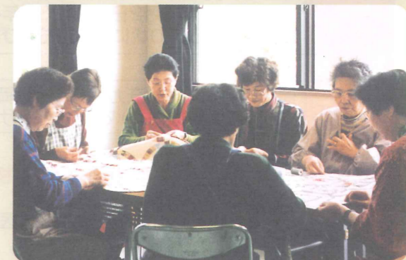
キルトを作成しているところ

エイズについての研修に参加し、ベビーキルトを一枚でも多く作って可愛い赤ちゃんを包んであげたいと、皆の思いがまとまりキルト作りを始めました。できあがったキルトは皆の心が一つとなって、喜びも大きな輪となり、キルト作りに取り組んで良かったと思います。エイズに対する差別や偏見がなくなることを願い、これからも続けていきたいと思っています。