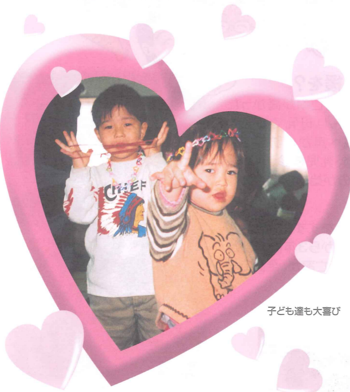
子ども達も大喜び

老人クラブの方から、どんぐりを使ったコマや、やじろべー、またお手玉の作り方を教わったり、あやとり、おり紙、ビーズ遊びをしました。「今回は、昔の遊びを楽しむことで既製のおもちゃに慣れた子ども達に創造力を導いてくれるよい機会になった」とおやこクラブの会長さんの声。愛育委員として今後も地域ぐるみで子育てを応援していきたいと思っています。