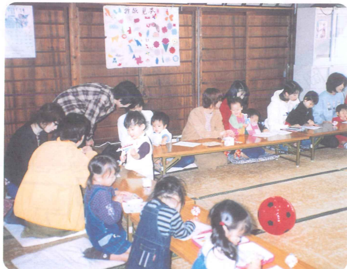
親子そろって昔遊び