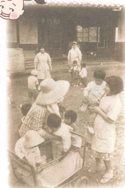
母子クラブ(現在のおやこクラブ)の様子(昭和37年)

母乳育児や検診をすすめてきたことで、昭和52年から3年間、乳児・新生児・周産期死亡率が、全国で一番低くなりました。