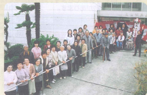
手すりの完成式の様子

上南地区愛育委員会は元気の出る会を応援しています。元気の出る会では近くの公園を散歩したり、公民館で食事をして楽しいひとときを過ごしています。4月には念願だった手すりが公民館に出来上がり、完成式には愛育委員が手作りの鈴割りを作り、皆で祝いました。今後もこの元気の出る会に地域の皆様の関心が高まることを願っています。