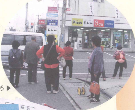
地区を探索しているところ▶

「ええとこ発見図」は、自分たちの住んでいる地域の良さを再発見しようという視点で作成したものです。作成過程で、何度も歩いたり、話し合いを重ねたりすることで、地域への愛着がさらに深まりました。「ええとこ発見図」は愛育委員ホームページからもご覧いただけます。ぜひご利用ください。