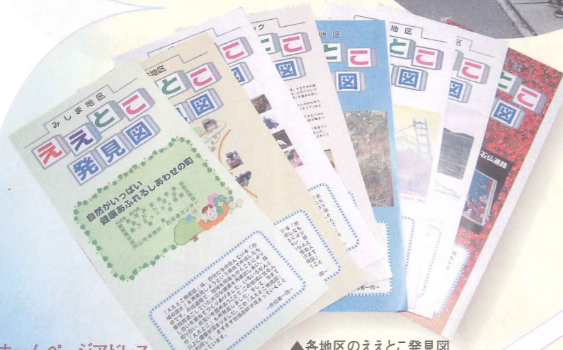
▲各地区のええとこ発見図

●第2・4水曜日(ただし、祝日は除く) 9:00~12:30 保健福祉会館2F 健康情報コーナー