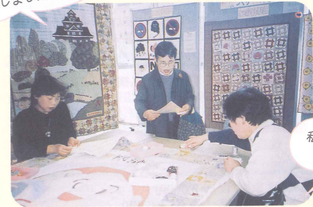
▲体験コーナーの様子