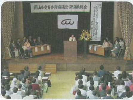
岡山市愛育委員協議会評議員総会

4月23日、市役所7階大会議室で平成26年度岡山市愛育委員協議会評議員総会並びに会長研修会を開催しました。平成25年度の活動報告とともに、今年度の重点目標や活動計画について提案し承認されました。