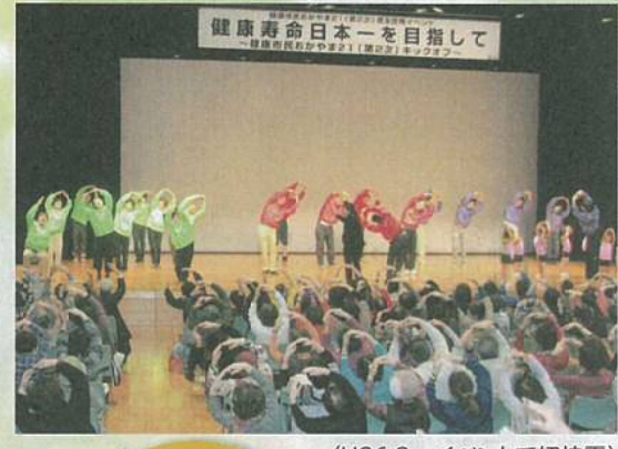
(H26.2 イベントで初披露)

普段の生活の中に気軽に取り入れられる体操を作って、生活習慣病の予防にもつなげたい。 高齢の方も無理せずできる体操にしたい。ロコモティブシンドローム(運動器症候群)の予防。介護予防にもつなげたい。 地域の行事の中に体操を取り入れることで世代を超えた交流ができ、地域の絆がより深まってほしい。