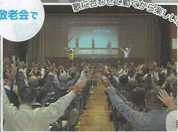
歌に合わせて動くから楽しいな