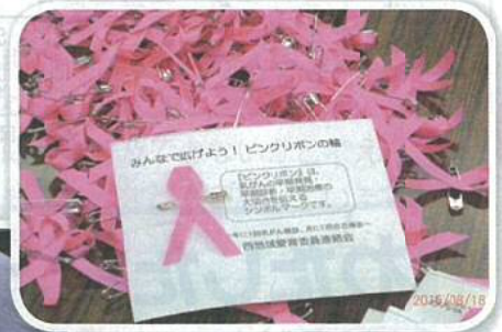
手作りピンクリボン