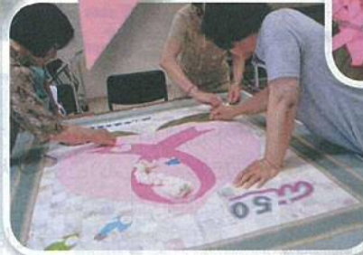
乳がん検診の啓発キルト作成中