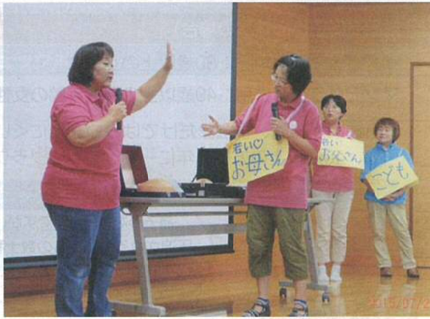
おやこクラブのお母さんたちに寸劇でPR