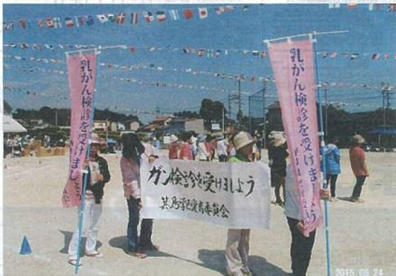
横断幕を持って呼びかけ