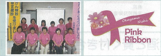
お揃いのポロシャツで活動中

これからもオリジナルピンクリボンをしっかりと活用して、若い人達にもPRする工夫を考え、さらに各種検診の啓発を進めていきます。