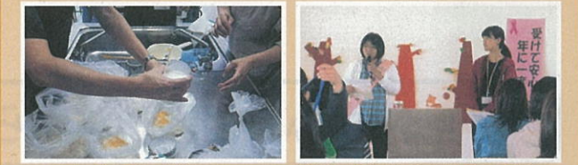
バッククッキングの体験

その他、10月には保健師さんと芳泉幼稚園を訪問し、乳がんの話やマンモモデルで乳がんの触診体験を行い、早期発見・早期治療の大切さを伝えました。参加者の中には、配布したピンクリボンをつけたり、検診について熱心に質問される方もいました。短い時間でしたが、自身の健康を守ることに気づく良い機会になりました。