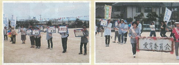
学区民体育祭での啓発パレード

「毎年、熱心に勤めてくれるから検診に行くよ」「検診に行ったよ」と学区の方からたくさんの声をいただいて嬉しく思い、これからも、学区の皆さんの健康を願って、パレードを続けていきます。