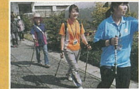
ポールを持ってウォーキング

友人と会話しながら、普段見過ごしていた大切な地域資源を再確認して歩き、意義ある時間を過ごすことができました。