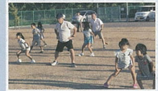
夏休み・ふれあいラジオ体操&amp;OKAYAMA!市民体操(政田地区防災広場にて)

また、昨年に引き続き、今年も夏休み期間、地域の子どもたちと一緒に「夏休み・ふれあいラジオ体操&OKAYAMA!市民体操」に取り組みました。今年は2カ所から3カ所に会場を増やし、みんなで朝から元気に身体を動かしました。運動だけでなく、三世代交流もでき、健康の輪・親子のふれあいと地域のみなさんの世代を越えた交流の輪を広げ、地域のつながりを深めています。