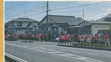
ウォーキング大会

西大寺中学校区は、吉井川河口域に広がり、西大寺会陽で有名な観音院の門前町として、また高瀬舟の寄港地として、古来より栄えた地域です。「ええとこ発見図」はそうした旧跡を訪ねたり、吉井川を堪能できるように10コースを選びました。昨年12月には、お寺や倉庫等古い街並の残る「いにしへの西川コース」を参考にウォーキング大会を開催し、50名の方に参加していただきました。