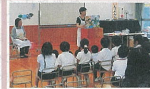
フッ素洗口紙芝居