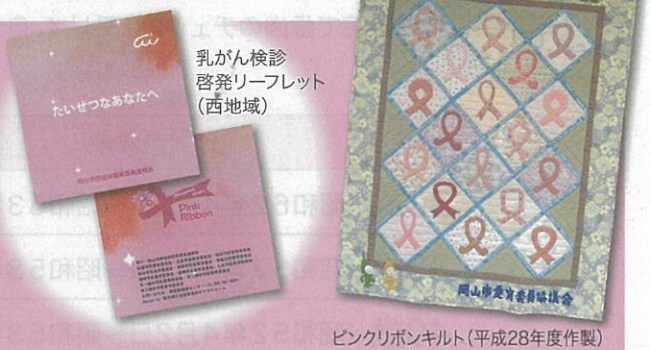
ピンクリボンキルト(平成28年度作製)