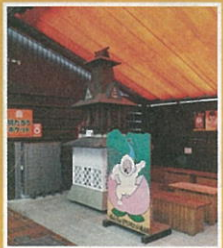
桃たるうポケット(無料休憩所)

作成を通して、他組織と関係ができ、絆が強くなりました。これからもみんなと力を合わせ、地域の子育て支援と健康寿命の延伸に努めていきたいと思います。