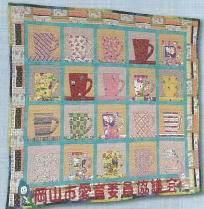
▲東日本大震災 復興応援キルト