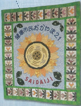
▲健康づくりキルト (健康市民おかやま21)