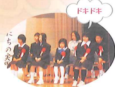
ポスター展 表彰式