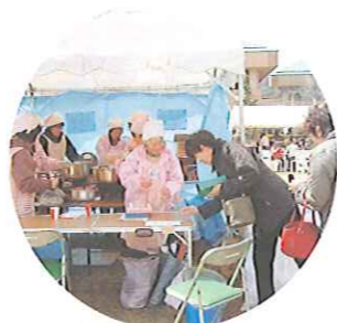
屋台 うどんコーナー

健康市民おやか21推進会議・岡山市の主催で、3月13日「健康フェスタ in ふれあい」が、岡山ふれあいセンター（桑野）で開催されました。