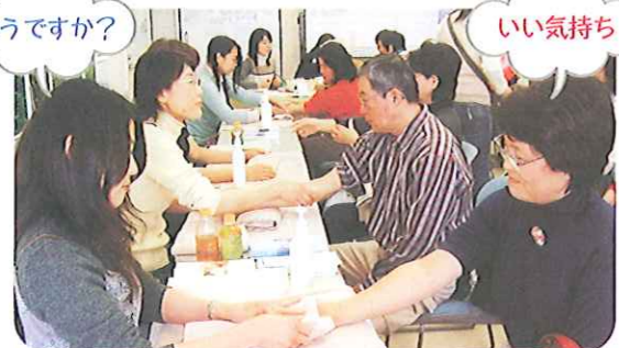
アロマのハンドマッサージ体験

また大ホールでは、それぞれの立場で、創意工夫や努力をして、地域に根ざした活動を続けている10組の団体による発表がありました。こうしたみんなの姿勢が、元気の輪を広げる原動力になっていると思います。愛育委員も他の団体の方々と協力しあって、これからも活動を続けて行こうと思いを新たにしました。