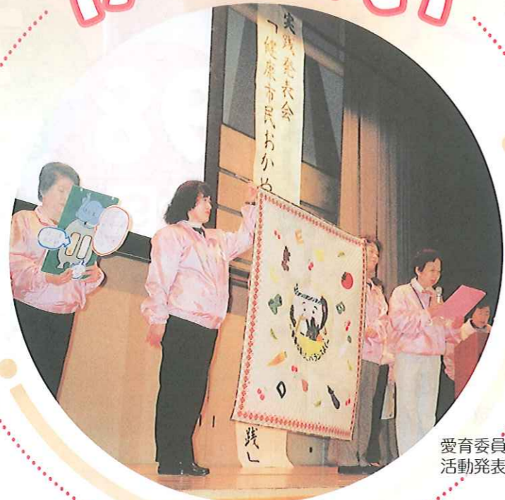
愛育委員による活動発表