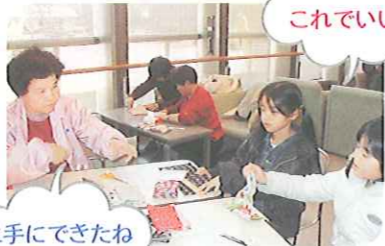
上手にできたね キルト体験