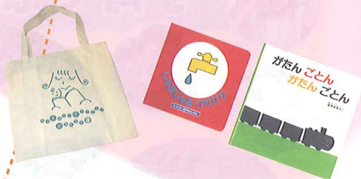
バックに入れてすてきな絵本を2冊お届けします!