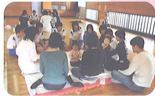
中学生と保護者の交流