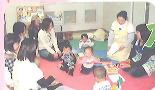
待ち時間の絵本の読み聞かせ体験