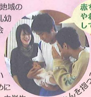
赤ちゃんって、やわらかくて、ふわふわしているな

愛育委員は、アドバイザーとして他のボランティアの人達と一緒に、中学生が赤ちゃんをだっこしたりあやしたりするときのサポートをしました。