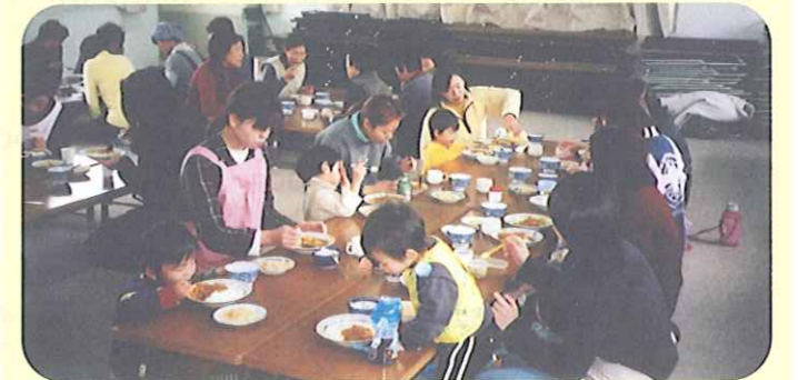
「おやこクラブとの交流会」