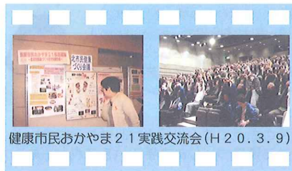
健康市民おかやま21実践交流会(H20.3.9)