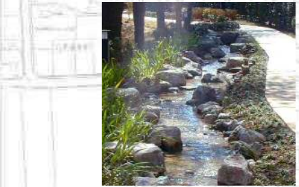
せせらぎの谷イメージ