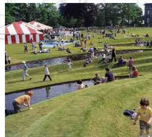
見晴らしの丘イメージ