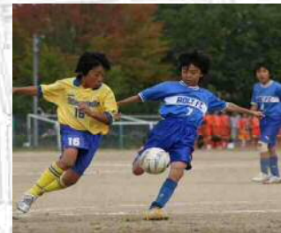
多目的広場イメージ