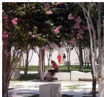
季節の名所イメージ (サルスベリ)