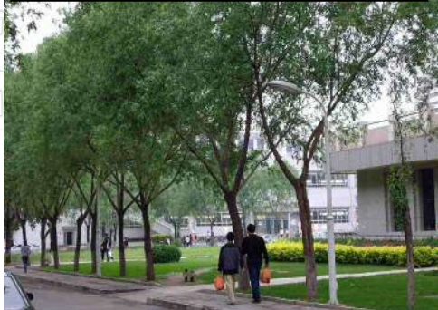
健康・医療・福祉系施設導入区域整備イメージ