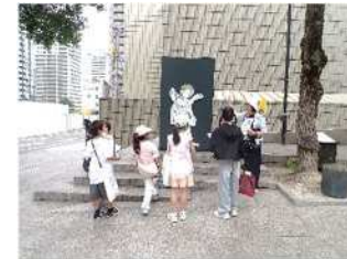
岡山市立オリエント美術館 (入口前)