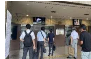
市役所内で作品展示