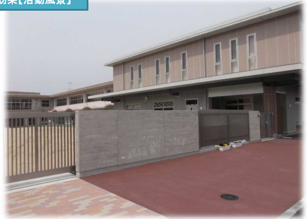
幡多認定こども園（R8年4月開園）