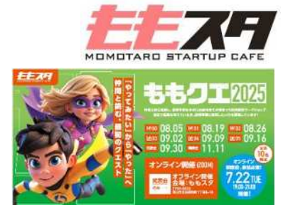
イノベーション基礎習得セミナー