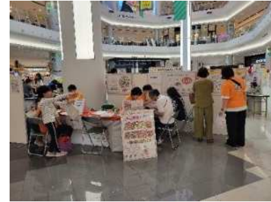
イベントへの ブース出展と 登録相談会

「みんなで歩活」を活用し、事業所を対象とした職場対抗戦を実施 成績上位事業所に市長表彰を行いました