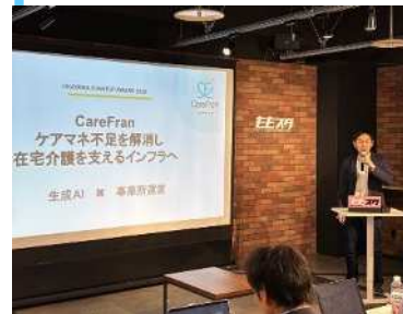
ももスタでのイベント風景