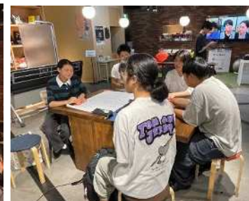
次世代起業家育成事業