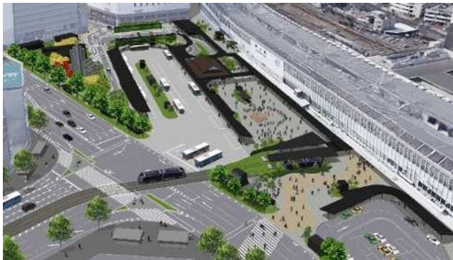
後楽園に見立てた統一デザインで整備

岡山駅は、国内有数の交通結節機能を有し、公共交通ネットワークの要でもあります。岡山市では、岡山駅の交通結節機能の強化を図るとともに、回遊性の向上、都心の活性化を図ることを目的に、岡山駅前広場への路面電車乗り入れ整備及び乗り入れを含めた岡山駅前広場整備を進めています。