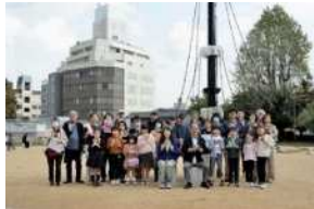
大集合！青豆の公園でハガキを書こう！ (パブリックプログラム)