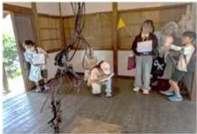
子どもナビと楽しむアートツアー (パブリックプログラム)

令和7年度の「岡山芸術交流2025」では、11か国30組のゲストが参加し、今回に限り全ての会場で鑑賞料を無料としました。学校鑑賞支援をはじめ、パブリックプログラム、アーティストック・トランスレータープログラム等に取り組み、いただいた寄附金を活用させていただきました。