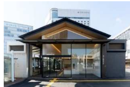
駅前広場内に整備した公共交通案内所

路面電車の乗り入れを契機に、駅前広場のリニューアルとして公共交通案内所を整備し、市民や来訪者に対して公共交通の利用環境の向上を図ることができました。