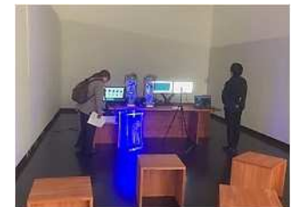
岡山県天神山文化プラザ