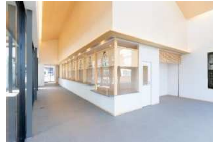
各バス事業者の窓口を設置