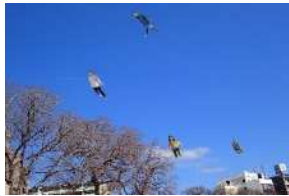
「飛ぶ人たち」 (アーティストック・トランスレータープログラム)