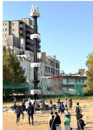
旧内山下小学校 (校庭)