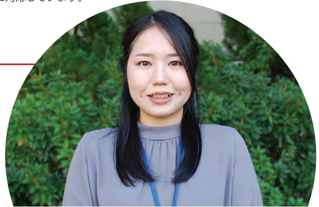
保健所健康づくり課 北区中央保健センター

地区担当保健師として母子保健や精神保健、感染症など市民の方々の健康相談に応じています。家庭訪問だけでなく、地域の方々と結成されたヘルスポランティア組織と協働して、生活習慣病予防や健康教室の企画・運営を行います。個別支援や各種業務を通じて日々学びを深めていながら、多くの人と出会い、つながりを得ることができます。