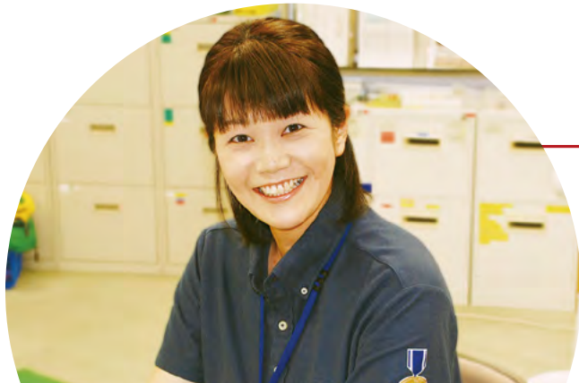
保健所健康づくり課 南区西保健センター

地区担当を持ち、母子や精神障害者の方などの支援を行うとともに、健康市民おかやま21事業を担当し、健康づくり活動に住民の方とともに取り組んでいます。また、センター内ではチームリーダーとしてチーム内の職員の相談にのり、困難な事例に直面した際には、一緒に考える姿勢を大切にしています。