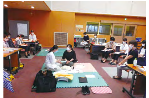
新人家庭訪問研修でのロールプレイ場面

また、保健師の専門能力の獲得のため、現場ではOJT(On the Job Training)を基本としながら、様々な専門職研修を行っています。保健師の専門能力の成長過程を段階的に整理した「キャリアラダー」と、個々の業務経験や研修履修履歴等を記録する「人材育成支援シート」を活用し、みんなで成長し合える仕組みを大事にしています。