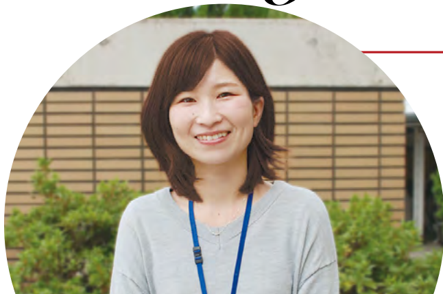
保健所健康づくり課 北区北保健センター

保健センターで勤務し、1つの中学校区を担当しています。地域で暮らす全ての人を対象に、訪問や電話等で声を聴き、様々な機関と連携しながら健康づくりのお手伝いをしています。虐待や引きこもり、難病など様々な方の対応に悩むこともありますが、ケース検討会議を行ったり、チームで話し合ったりなど相談できる体制が整っているので、安心して働くことができます。また地区組織活動も活発で地域の方から色々学ばせていただけることも大きな魅力です。