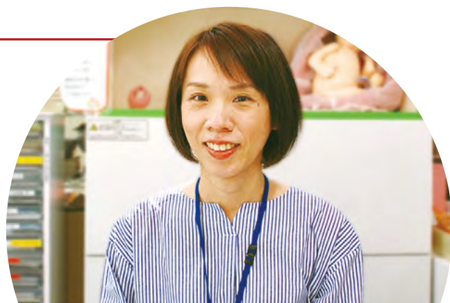
保健所健康づくり課 母子歯科保健係

妊娠期～乳幼児期の保健事業の企画をする係で、私は妊娠届の窓口である子育て世代包括支援センター、発達に不安をもつ親子の経過観察児教室などの企画調整を行っています。多職種・他機関と連携し親子を支えるネットワークづくりも行っています。また、地区組織「おやこクラブ」の事務局担当として、地域の方と連携し「親子の健やかな育ち」を目指した地域づくりに取り組んでいます。