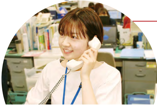
保健所健康づくり課 健康増進係

保健師は保健所以外にも、市役所（本庁）の保健福祉、教育、子ども分野など、様々な部署に配属されています。それぞれの経験を生かし、オール岡山市で市民の健康と生活を守るために頑張っています。