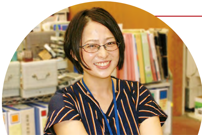
高齢者福祉課 在宅支援係

認知症施策の事業担当として、認知症についての正しい知識の普及啓発から、住み慣れた地域で認知症とともに生きることができる地域づくりに至るまで、幅広く施策の立案や企画を行っています。事業を展開していく中では、行政内の関係課だけではなく、認知症当事者やそのご家族、支援者の方に直接想いを聴きに出向いたり、市内の民間企業等とも岡山市が目指しているまちづくりに向けての話し合いを行い、課題の明確化や市民の方々にとって必要な施策を考え「誰もがよりよく生きる健康・福祉のまち」を目指しています。