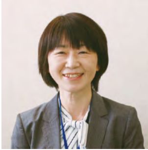
保健福祉局 感染症対策担当局長