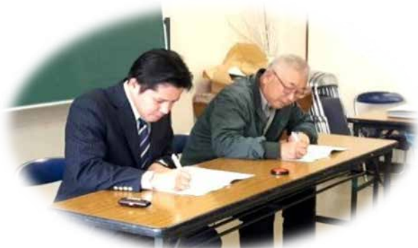
運行事業者との協定書締結

平成28年11月から平成30年3月までの間、試験的に運行し、平成30年4月より本格運行に移行しました。今後も様々な課題と向き合いながら、地域の皆様に愛着を持ってもらえるよう、利用促進や運行改善に取り組んでいきます。迫川で実績が上がれば、灘崎地域の他地区と一緒に進めていきたいと考えています。