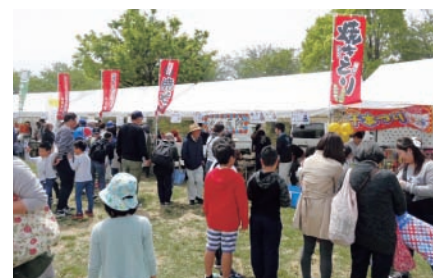
▲屋台コーナーの様子