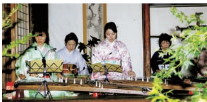
▲お月見会での琴の演奏

春の桜まつりは、地域を流れる宇甘川下流の河川敷で開催。御津中・岡山御津高校吹奏楽部による演奏や、