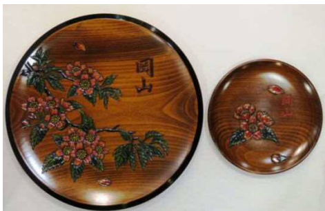
左：HOD 飾盆(桜)、右：随行者 丸盆(桜)