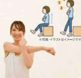
※写真はイラストはイメージです。