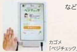
カゴメ「ベジチェック」