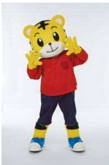
しまじろう