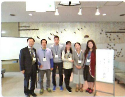
10月29日 「ベトナムの遊び」

「ベトナムの遊び」「見て、知って、味わう！フェアトレードを体験しよう！」の異文化を体験しながら、外国人市民と日本人市民が交流を図りました。