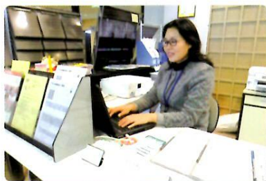
相談窓口（友好交流サロン）

* 祝日（月曜日と重なる場合は翌日も）毎月第2日曜日、12月28日～1月4日を除く