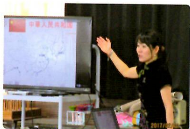
岡山市立伊島小学校