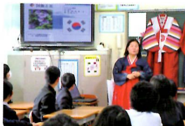
岡山市立古都小学校