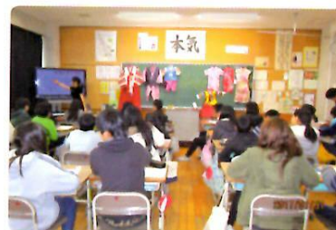
岡山市立操明小学校