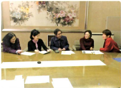
あくら編集会議の様子

「あくら」は日本語に英語、中国語、ハングル、スペイン語、ポルトガル語、ベトナム語も併記し、6ヶ国語で年に4回発行している生活情報紙です。ボランティア編集員の皆さんが岡山近郊のトピックや季節の話題など地域に密接する情報を取り上げ記事にしています。