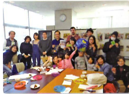
1月28日 「見て、知って、味わう！ フェアトレードを体験しよう！」