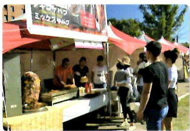
おokayama国際音楽祭 2016 下石井 3DAYS でのワールド屋台（10月9日～11日）

今年はいにくの天候でしたが、ワールド屋台では世界の料理を販売、文化紹介ブースではバングラデシュやネパールの文化を紹介したりして、多文化共生への理解を深めました。