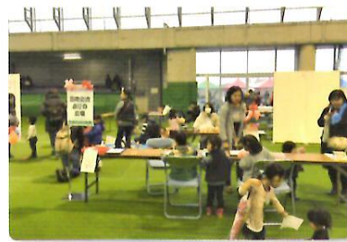
人権フェスティバル岡山での文化紹介ブース（12月4日）