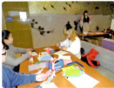
11月26日 「おりがみアートを楽しもう」