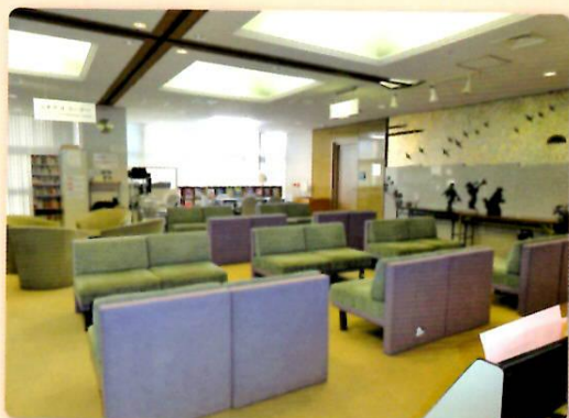
友好交流サロンの様子

西川アイプラザ（岡山市北区幸町）の4階に市民と外国人が気軽にふれあえる場として「友好交流サロン」があります。みなさんのお越しをお待ちしています。