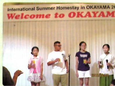
海外の子どもたちによる乾杯の音頭