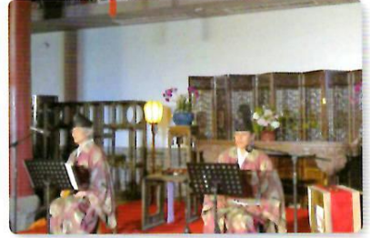
日中民族音楽演奏会