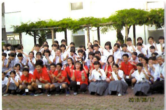
学校訪問（岡山市立京山中学校）