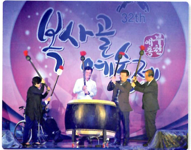
「第32回ボクサゴル芸術祭」開幕式