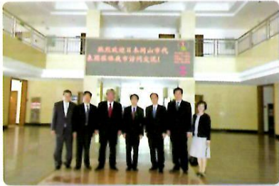
洛陽市人民代表大会主任表敬訪問

訪問中、「日中民族音楽演奏会」が洛陽市の隋唐大運河博物館内「上陽琴院」で開催され、岡山市からの演奏家4名が琴、篠笛、笙などで日本の伝統音楽を披露し、洛陽古琴学会と音楽文化の交流を通じて、両市の友情を深めました。（4月20日～22日）