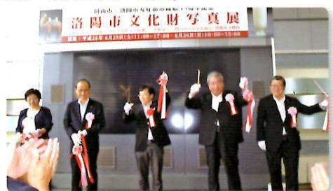
オープニング式典

オープニング式典には岡山市長、岡山市議会議長、岡山市洛陽市友好都市議員連盟会長、岡山市日中友好協会会長、洛陽市文化財視察訪日団15名が出席し、大勢の参加者で賑わいました。両市の相互理解が一層深まりました。（6月25日～26日）