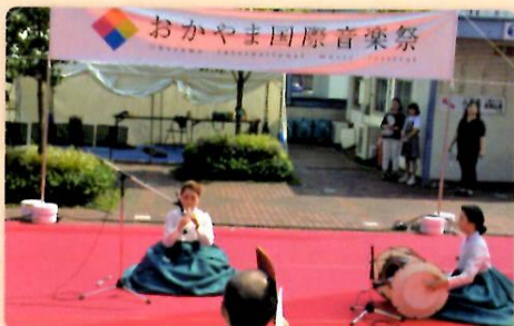
岡山駅前演奏する富川市民俗芸術団