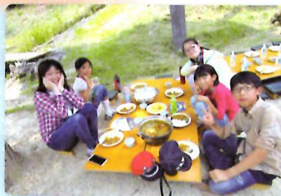
今日のお昼は自分たちの作ったカレー