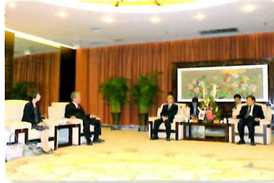
洛陽市長表敬訪問