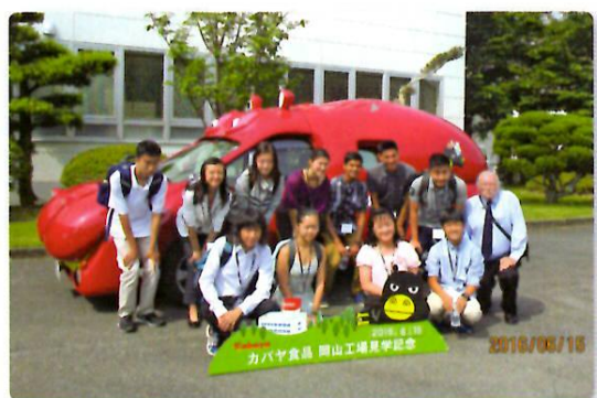
工場見学の様子（カバヤ食品岡山工場）

アメリカ合衆国・サンノゼ市等より学生10名（引率者2名）が来訪し、企業・学校訪問、日本文化体験プログラム、市内家庭でのホームステイなどを通して、日本文化への理解を深め、岡山の持つ魅力を堪能しました。 （6月14日～20日）