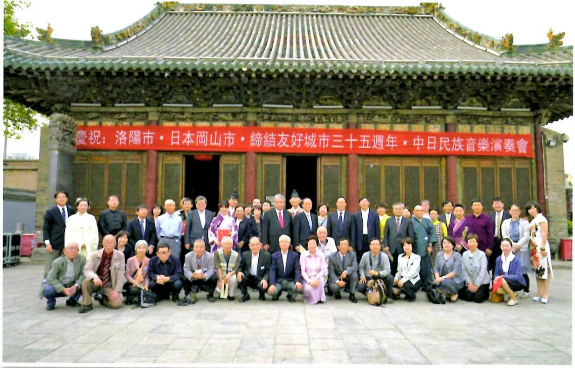
岡山市洛陽市友好都市締結 35 周年記念「日中民族音楽演奏会」会場前