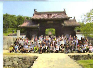
旧閑谷学校の校門にて

この日は、備前市の岡山県青少年教育センター閑谷学校を訪問し、野外炊事とオリエンテーリングを実施しました。非常に暑い中、子どもたちはグループで活動し、しっかりとコミュニケーションを図りながら活動していました。